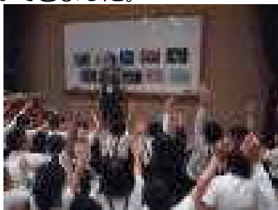
オリエント美術館