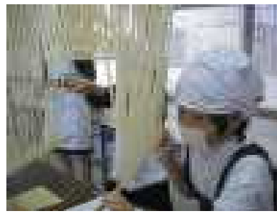
かも川手延そうめん