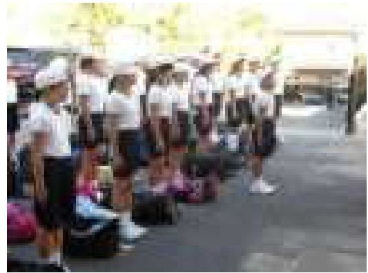
みんなに見送られての出発式です

9月17、18日の2日間、5年生が海の学習に行ってきました。残暑の厳しい中ではありましたが、渋川青年の家での1泊2日の宿泊研修を通して、秩序・友情・実践の心を養い、心身共にたくましく成長して帰ってきました。いろいろな活動や生活の中で、日頃学校で培ってきた吉備小のすばらしい伝統を生かし、先のことを考えて黙って素早く集合したり、元気のよい挨拶や返事をしたりして、吉備小学校の代表として立派な態度で2日間を過ごすことができました。この度の経験を今後の学校生活にしっかり生かしてほしいと思います。