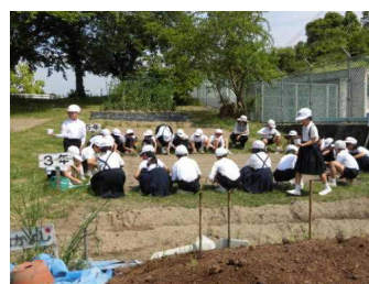
3年生 ホウセンカ種植え