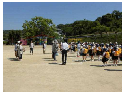
出発式の様子です

5月22日（水）、子どもたちの安全な登下校でお世話になっている『こども110番』協力者の皆さんのお宅を訪問させていただきました。一斉下校時に、PTA育成部員、教職員、登校班児童が協力者の方々のお宅を訪れ、日頃のお礼と今年度のお願いの挨拶をさせていただきました。現在23名の方にお世話になっています。子どもたちの安全安心な登下校に今後ともご協力をよろしくお願い致します。育成部員の皆様ありがとうございました。