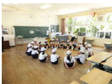
楽しく遊んでいます。