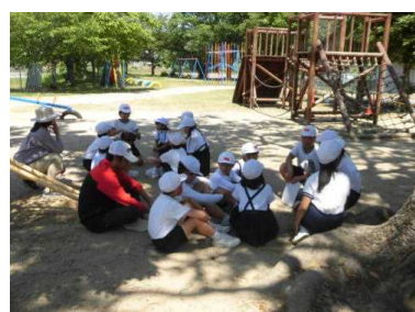
振り返りの時間です。