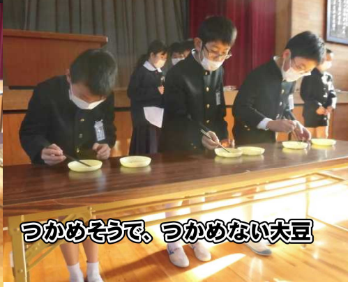
つかめそうで、つかめない大豆