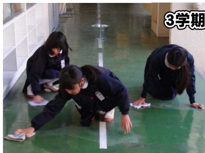
3学期も朝掃除をがんばっています!