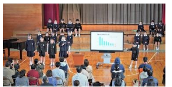
▲5年生「バケツ稲作りから学んだこと」