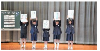
▲4年生「今、ぼくたちにできること ~水の学習を通して~」