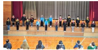
▲1年生「おむすびころりん」

11月20日(土)には、学習発表会がありました。本年度は、例年の劇を中心とした「学芸会」ではなく、日頃の学習の成果を発表する「学習発表会」でした。練習段階から、感染症を予防する必要があるため、時間も短くし、合唱は行わないなど、感染のリスクが高い活動をなくし、子どもたちが練習してきたものが発表できる内容にして行いました。観客も、人数制限を設け、学年ごとに観客を入れ替えるなど対策をさせていただきました。保護者の皆様には、ご協力いただき、ありがとうございました。子どもたちは、一生懸命、それぞれ学習の成果を発表することができました。