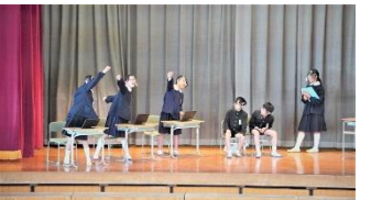
▲6年生「私たちの金光町 ~過去・現在・未来~」