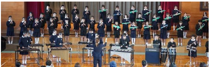
▲4・5年生「アフリカンシンフォニー」