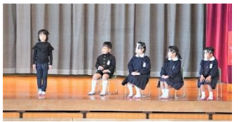
▲2年生「町がだいすき たんけんたい」