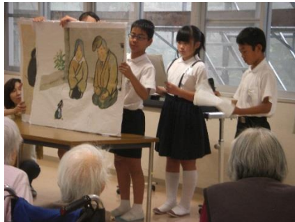
【大型紙芝居 いっすんぼうし】