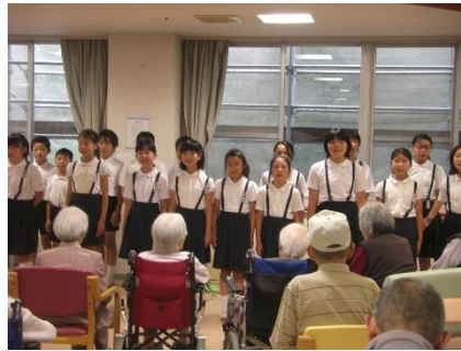
【♪水戸黄門・ふるさと♪】